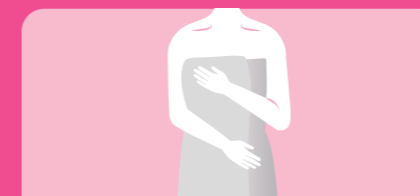
Tomar banho ou duche