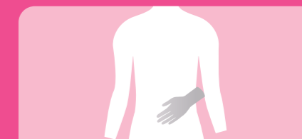
Toalhete 2: Costas