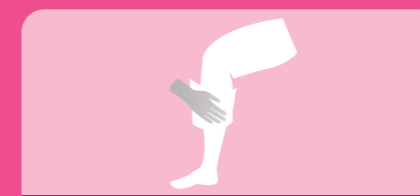
Toalhete 6: Perna e pé direito