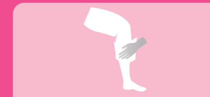
Toalhete 5: Perna e pé esquerdo