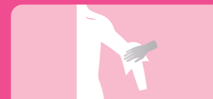
Toalhete 3: Braço e axila esquerdo