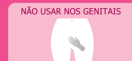
Toalhete 8: Virilhas