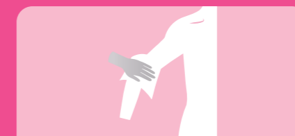
Toalhete 4: Braço e axila direito