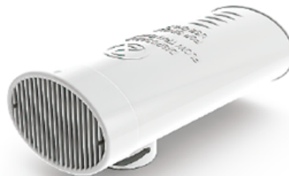
REF: M9256-SP-90 - MEDIKRO SPIROSAFE CDM: Z4175900 NPDM: Z12150185

REF: M9474(3L) / M9477(1L) - MEDIKRO SERINGA DE CALIBRAÇÃO