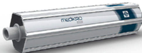
REF: M9474(3L) / M9477(1L) - MEDIKRO SERINGA DE CALIBRAÇÃO